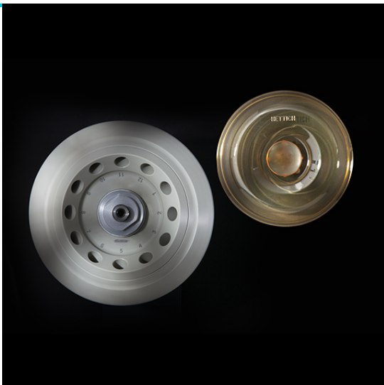
Арт. 1252-А. 12-местный угловой ротор