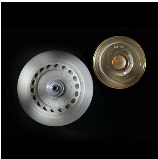
Арт. 1258-А. 18-местный угловой ротор